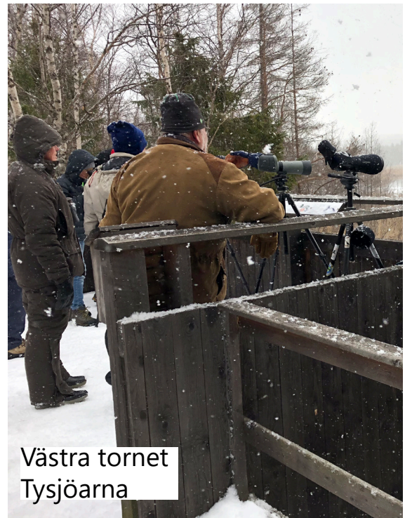
Västra tornet Tysjöarna