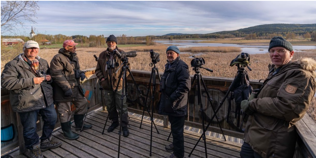
Fågeltornskampare vid Kyrkbyttjärn