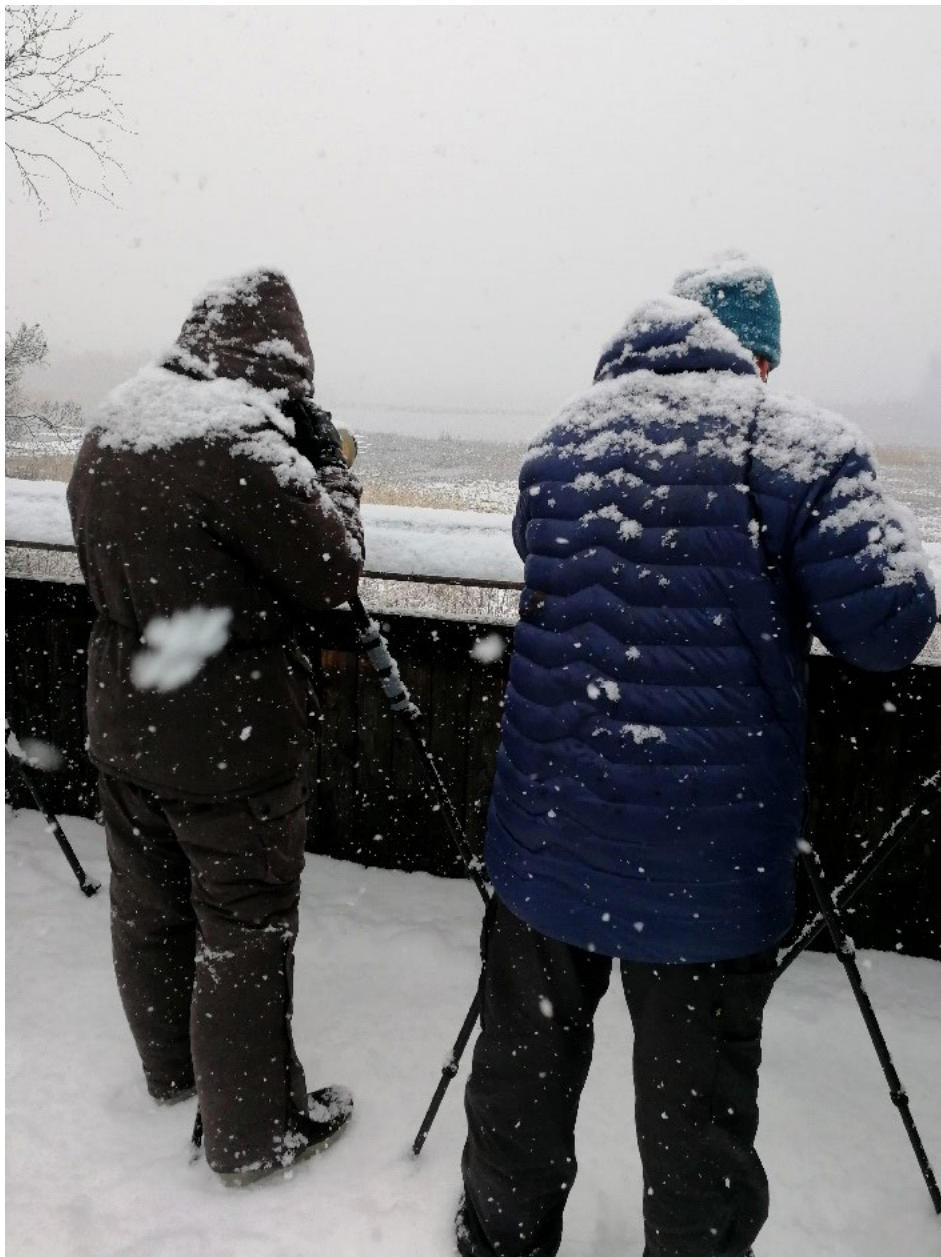
Fågeltornskamp vid Tysjöarna Jämtland

Herculestornet, Kristianstads Vattenrike