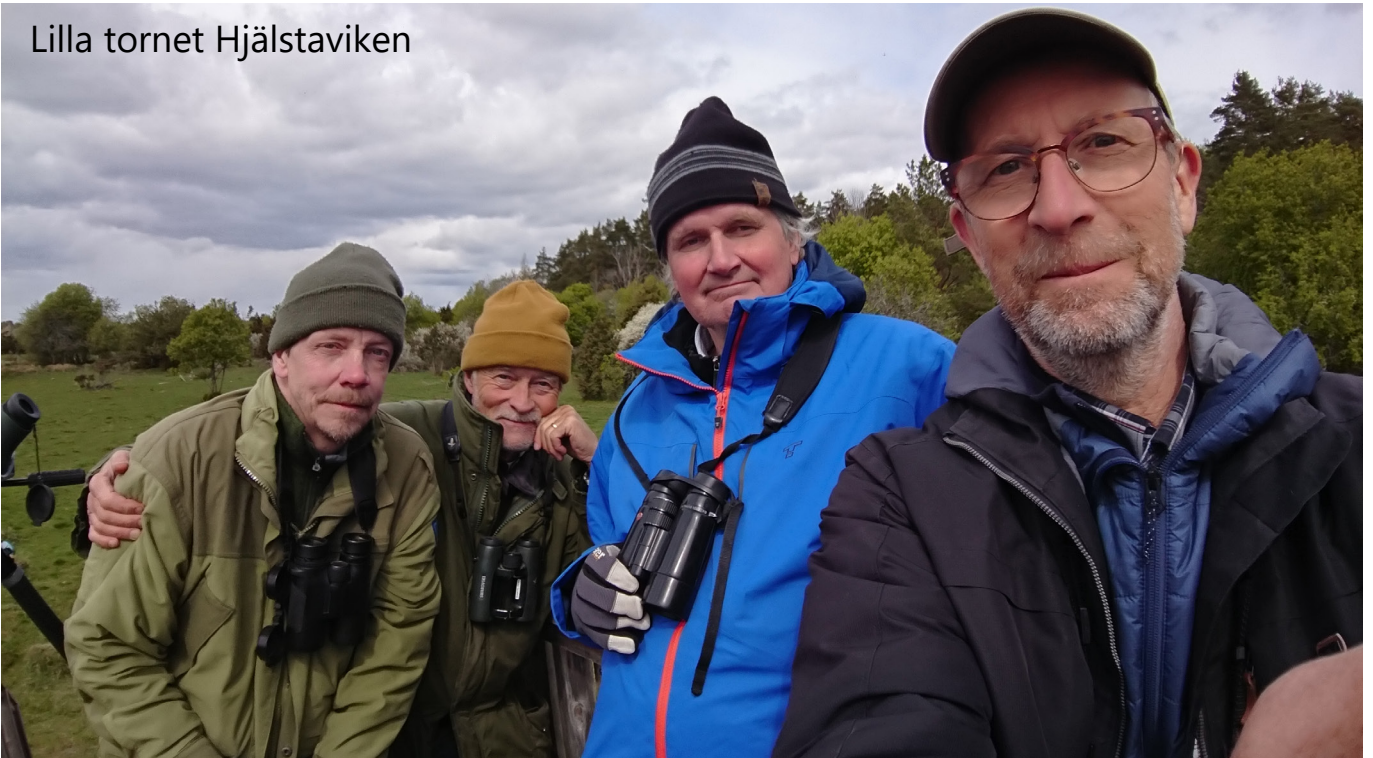
Lilla tornet Hjälstaviken